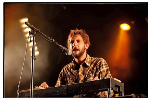
Band of Horses

L'équipe de la Feuille de Route : froggydelight.com : MM, David, Rickeu, Little Tom, Romain, Fred, Photos : Tasteofindie.com.