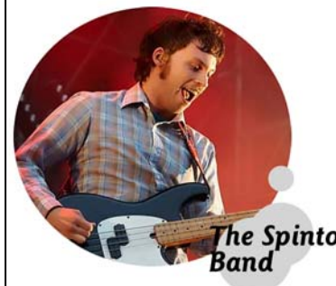
The Spinto Band

Rien de bien nouveau, mais une passion communicative, qui fait plaisir à voir et à entendre.